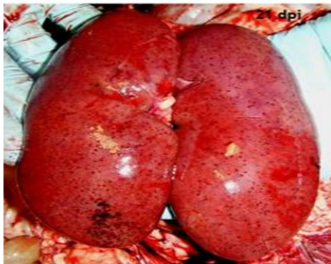
Thận xuất huyết điểm