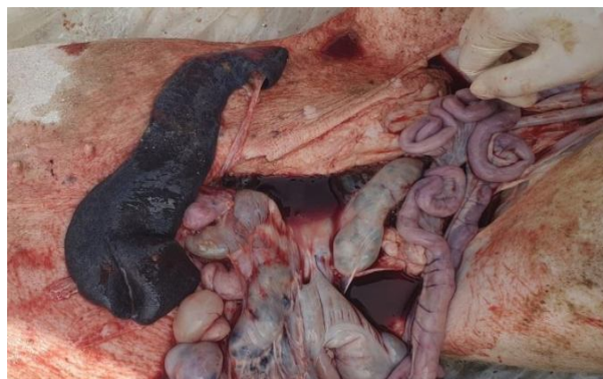
Lách sưng to, nhồi huyết