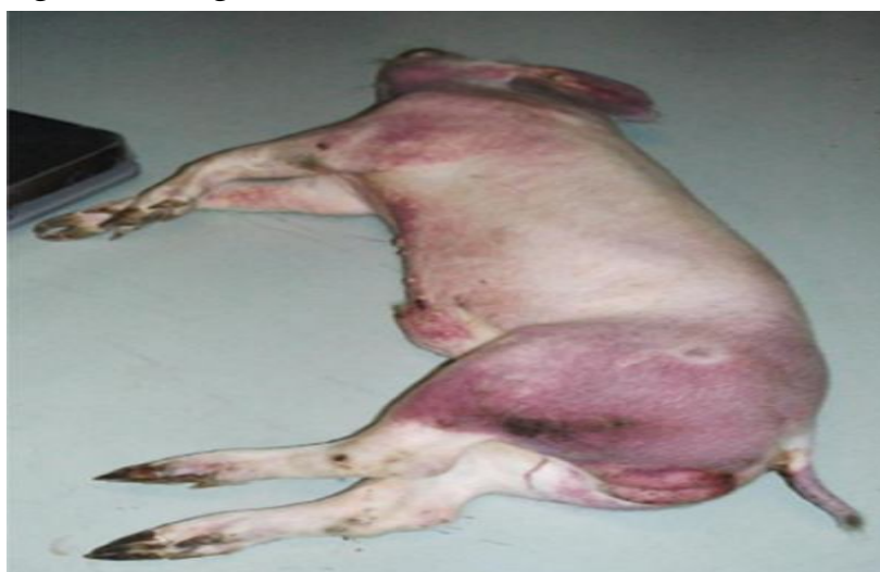
Xuất huyết đuôi, cẳng chân, ngực, bụng