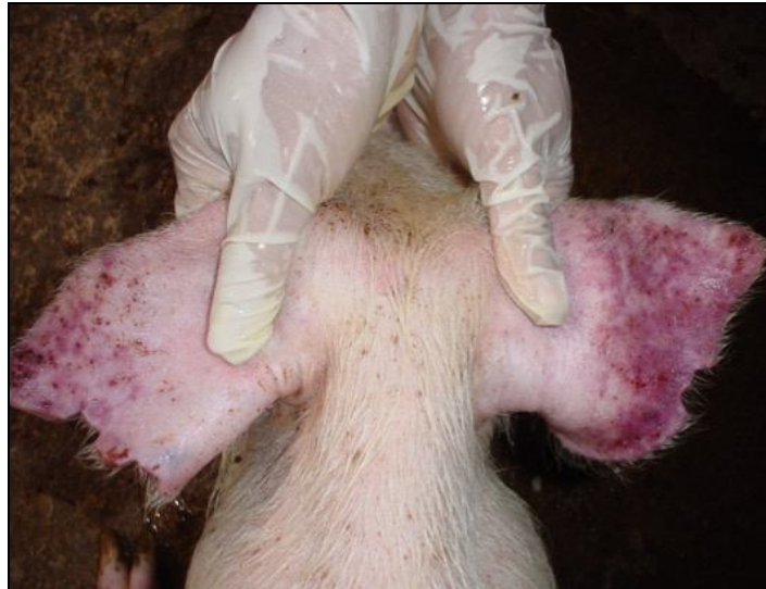
Xuất huyết vành tai

- Trong 1-2 ngày trước khi con vật chết, có triệu chứng thần kinh; lợn mang thai có thể sảy thai.